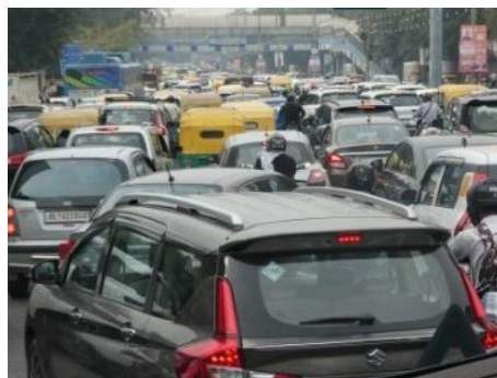
Circulation à Dehli