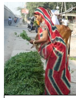
Vendeuse d'herbes pour nourrir les vaches sacrées

Côté environnement, nous avons démarré notre périple dans le brouillard très irritant de Delhi et dans sa circulation chaotique et embouteillée. Le lendemain de notre visite, pour contrer la pollution