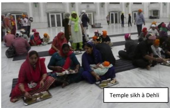
Temple sikh à Dehli

Le Rajasthan, c'est une population très colorée, très souriante, mais aussi très individualiste du fait du système de castes. La société indienne est hiérarchisée, basée sur quatre varna (Brahmanes, Kshatriyas, Vaishyas, Shudras) et les Intouchables (hors-castes). Bien qu'abolie par la Constitution de 1950, la discrimination de caste persiste, notamment en milieu rural, malgré des politiques de quotas (discrimination positive) dans l'éducation et l'emploi. Notre guide local nous en a longuement parlé.