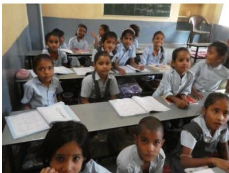
Ecole de village

Différentes activités, hors circuit, nous ont été proposées tels que : cours de cuisine, yoga, magie, cinéma bollywood, visite d'une école de village, tour en dromadaire et même nourrissage des vaches sacrées !! Par ce biais nous avons été immergés dans les coutumes régionales, eu des contacts avec les locaux même si parfois un peu trop superficiels.